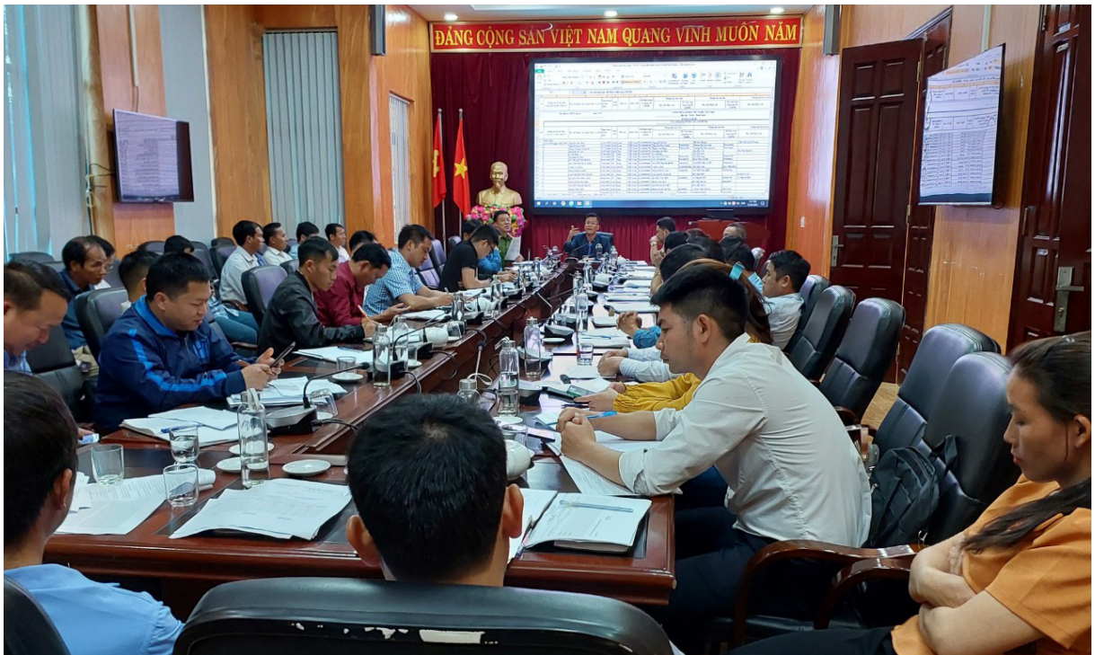
Lãnh đạo UBND huyện phát biểu tại hội nghị.

Để tiếp tục triển khai thực hiện Quyết định số 06/QĐ-TTg ngày 06/01/2022 của Thủ tướng Chính phủ về phê duyệt Đề án phát triển ứng dụng dữ liệu dân cư định danh và xác thực điện tử phục vụ chuyển đổi số quốc gia giai đoạn 2022-2025, tầm nhìn đến năm 2030; Quyết định số 2137/QĐ-BTP ngày 11/12/2015 của Bộ Tư pháp về việc phê duyệt Đề án “Cơ sở dữ liệu điện tử hộ tịch toàn quốc”, trên cơ sở chỉ đạo của Chủ tịch UBND tỉnh tại Công văn số 4240/UBND-NC ngày 30/12/2022, UBND huyện đã tổ chức Hội nghị tập huấn, hướng dẫn, thực hiện việc rà soát, đối sánh, cập nhật, số hóa dữ liệu hộ tịch từ sổ hộ tịch.