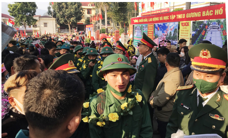
Nô mức Ngày hội tòng quân.

Năm 2023, tỉnh Điện Biên có 1.141 thanh niên lên đường nhập ngũ, trong đó thực hiện nghĩa vụ quân sự là 800 thanh niên và nghĩa vụ công an Nhân dân 341 thanh niên tại các đơn vị: Trung đoàn 82, Quân khu 2 (390 tân