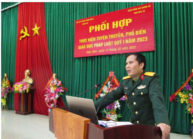
Hội nghị phối hợp tuyên truyền phổ biến giáo dục pháp luật tại Viện Kiểm sát quân sự khu vực 23.

Tại buổi tuyên truyền, cán bộ, chiến sỹ trong đơn vị đã được nghe báo cáo viên giới thiệu chuyên đề Luật Phòng, chống tác hại của rượu bia năm 2019. Báo cáo viên đã đi sâu vào phân tích thực trạng, hệ quả của việc sử dụng rượu bia, biện pháp quản lý và giảm mức tiêu thụ, đặc biệt là phân tích tác hại của việc sử dụng rượu bia khi tham gia giao thông gắn với liên hệ trực tiếp những vụ việc cụ thể xảy ra trên địa bàn, từ đó đề ra những giải pháp cần thiết nhằm hạn chế tác hại của bia rượu.