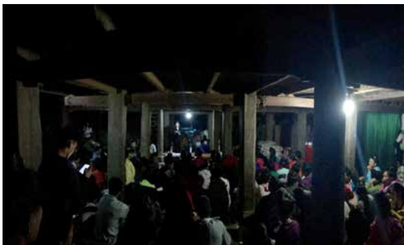
Trợ giúp viên pháp lý thực hiện công tác trợ giúp pháp lý miễn phí cho người dân.

Nhằm giúp người dân hiểu về quyền được trợ giúp pháp lý miễn phí của mình,