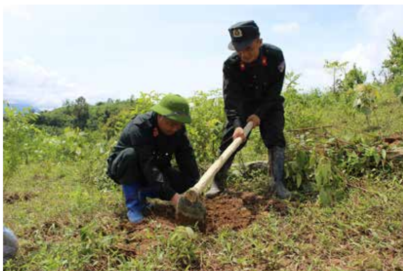
Cảnh sát cơ động Điện Biên trồng rừng tại huyện Mường Nhé.

Để hoàn thành nhiệm vụ được giao, trong những năm qua, lãnh đạo đơn vị đã thường xuyên bổ sung, xây dựng mới và tổ chức luyện tập thuần thục các phương án tác chiến, các phương án bảo vệ mục tiêu. Phối hợp tác chiến nhiều lực lượng, sử dụng nhiều phương tiện, vũ khí, công cụ hỗ trợ để từng bước nâng cao khả năng chỉ huy tác chiến của đội ngũ chỉ huy các cấp về tư duy chiến thuật gắn với thực tiễn và năng lực thực tiễn của đơn vị, làm cơ sở cho công tác chỉ huy, thực hành các phương án tác chiến khi có tình huống phức tạp xảy ra. Quá trình tổ chức huấn luyện luôn bám sát phương châm “cơ bản, thiết thực, vững chắc”, huấn luyện từ đơn giản đến phức tạp, sát với thực tế chiến đấu với mọi địa hình, thời tiết, lấy huấn luyện thực hành là chủ yếu. Duy trì nghiêm kỷ luật, bảo đảm tuyệt đối an toàn về người, vũ khí, công cụ hỗ trợ, trang bị phương tiện. Kết thúc các nội dung huấn luyện tổ chức kiểm tra, đánh giá kết quả,