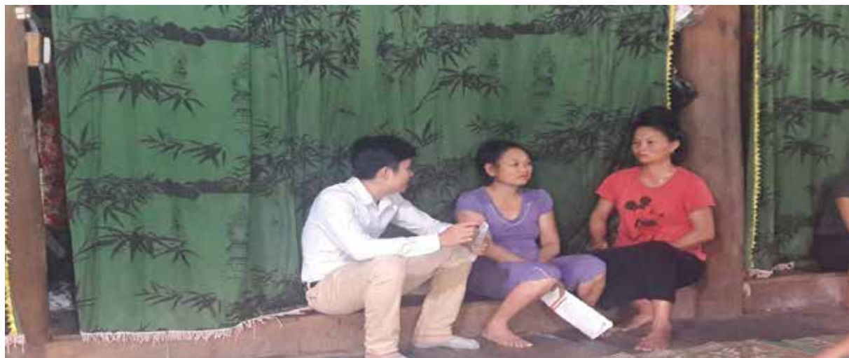
Thực hiện tư vấn, hướng dẫn, giải đáp pháp luật cho người dân.

các Trợ giúp viên pháp lý đã dẫn chứng những sự việc xoay quanh đời sống hàng ngày, những vướng mắc tưởng chừng như luôn luôn xảy ra trong quá trình sinh sống của người dân. Những câu hỏi tưởng chừng như đơn giản, những tranh chấp xuất hiện hàng ngày trong đời sống của người dân như một dấu hỏi còn đang để lửng mà người dân vẫn loay hoay tìm câu trả lời, tìm địa chỉ tin cậy để được hướng dẫn, giải đáp. Dưới sự hướng dẫn tận tình của Trợ giúp viên pháp lý, người dân tiếp cận dễ dàng hơn và chia sẻ những vướng mắc mà mình còn chưa biết cách bày tỏ, chưa thấu hiểu. Qua buổi làm việc, người dân đã được giải đáp từng vụ việc cụ thể. Ngoài ra, Trợ giúp