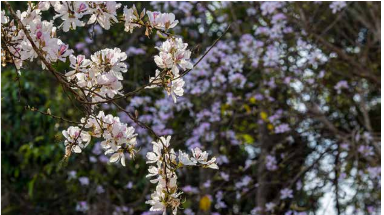
Hoa Ban khoe sắc.

Sự tích Hoa Ban được viết lên rất tình nhưng cũng rất nhẹ mà lại được sắc vị của núi rừng Tây Bắc. Truyện kể rằng, người con gái tên Ban xinh đẹp nét na với giọng hát làm mê đắm lòng người. Trái tim nàng sớm đã dành trọn cho chàng Khum dù rằng có rất nhiều trai làng theo đuổi. Vì chê chàng Khum nghèo, cha Ban đã ép gả cô cho con trai của một tộc phú quanh vùng, vừa gù vừa lười biếng và xấu tính. Nàng trốn chạy khỏi nhà, tìm đến với người yêu để kêu cứu nhưng lúc này Khum lại đi xa. Không quản xa xôi cách trở, Ban