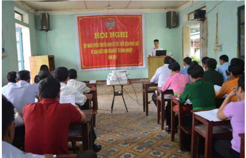
Hội nghị tuyên truyền pháp luật do Hội Nông dân tổ chức

Hội Nông dân 10/10 huyện, thị, thành phố đã phối hợp tổ chức 67 lớp tập huấn, hội nghị tuyên truyền Nghị quyết, chỉ thị của Đảng, nghị quyết Đại hội Hội nông dân các cấp, tuyên truyền các bộ Luật, các chương trình mục tiêu quốc gia...cho trên 6.000 cán bộ, hội viên, nông dân tham gia. Tại các xã, phường, thị trấn, Hội Nông dân tỉnh chỉ đạo Hội Nông dân cơ sở phối hợp cùng các Ban, ngành duy trì 130 ngăn sách, tủ sách pháp luật. Hội còn duy trì hoạt động 18 câu lạc bộ “Nông dân với pháp luật” với 1.256 thành viên tham gia. Tổ chức cấp phát 2.000 tờ rơi về giao thông, hơn 200 cuốn “Hỏi đáp pháp luật”, 10 loại tờ rơi về pháp luật bảo vệ môi trường và đất đai với số lượng 570 tờ, 150 đĩa “Đàn ông đích thực nói không với bạo lực” về phòng chống bạo lực gia đình, 200 cuốn tài