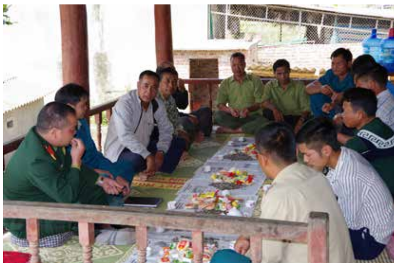
Tuyên truyền Luật nghĩa vụ quân sự tại xã Núa Ngam huyện Điện Biên.

Cùng với việc tổ chức các trò chơi trong dịp lễ hội Bánh chưng xanh, đơn vị LLVT đã kết hợp tuyên truyền 10 buổi về Luật Biên giới, quy chế biên giới, Luật