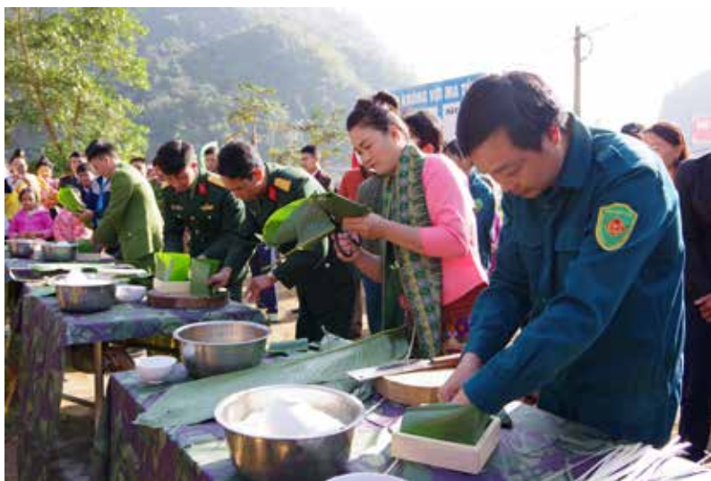
Gói bánh chưng tại lễ hội

Với quan điểm “người người có tết, nhà nhà có tết” và không để bất cứ gia đình nào bị đứt bữa trong dịp tết nguyên đán Kỷ Hợi 2019 đặc biệt là bà con các dân tộc nghèo ở địa bàn các xã biên giới, vùng cao thuộc huyện Mường Nhé, Nậm