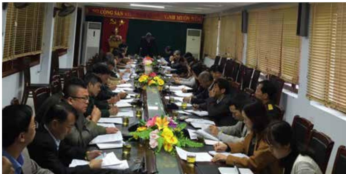
Toàn cảnh phiên họp Hội đồng phối hợp phổ biến giáo dục pháp luật tỉnh Điện Biên tháng 01/2019.

nước về PBGDPL; tiếp tục đổi mới nội dung, hình thức PBGDPL phù hợp với từng nhóm đối tượng, địa bàn, lĩnh vực quản lý tập trung vào các luật, pháp lệnh, văn bản mới ban hành hoặc thông qua năm 2018 và năm 2019, các quy định pháp luật, dự thảo luật, pháp lệnh quan trọng, liên quan trực tiếp đến hoạt động sản xuất, kinh doanh, quyền và lợi ích hợp pháp của người