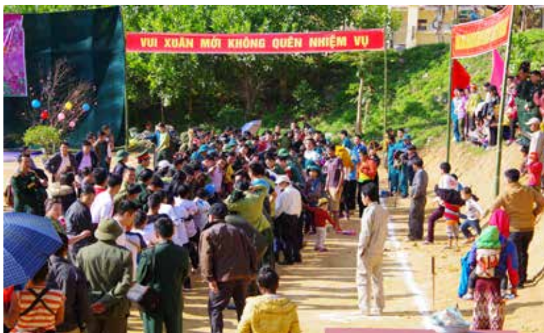
Quang cảnh Lễ hội Bánh chưng xanh 2019

Lễ hội bánh chưng xanh với chủ đề Xuân biên cương - Âm tình quân dân thực sự là ngày Hội lớn của nhân dân các dân tộc các địa bàn biên giới và lực lượng vũ trang, đồng thời là dịp để mỗi cán bộ, chiến sỹ, đoàn viên thanh niên có cơ hội gặp gỡ, giao lưu góp phần thể hiện tinh thần đoàn kết,