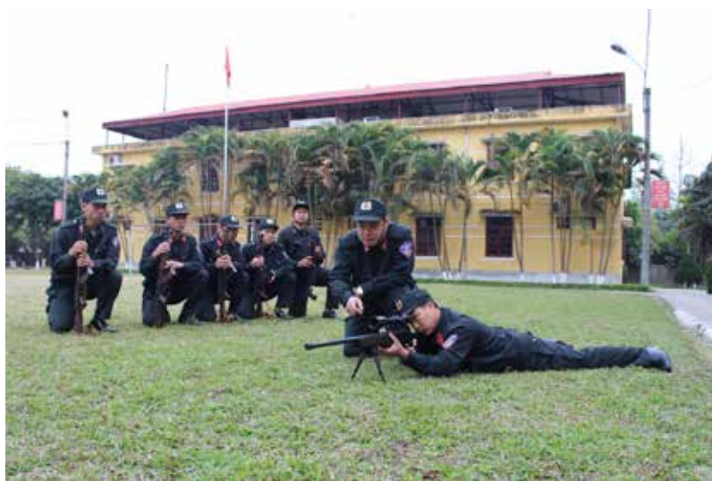
CBCS Cảnh sát cơ động luyện tập sử dụng vũ khí

Đúng với tên gọi “cảnh sát cơ động”, đây là đơn vị có chức năng xây dựng, thực hiện các phương án bảo vệ tuyệt đối an toàn về ANTT các mục tiêu, công trình trọng điểm, thiết yếu, cơ mật trên địa bàn toàn tỉnh; tham gia bảo vệ an toàn tuyệt đối các đồng chí lãnh đạo Đảng, Nhà nước, hàng trăm ngàn lượt khách trong nước, khách nước ngoài đến làm việc, tham quan trong tỉnh;