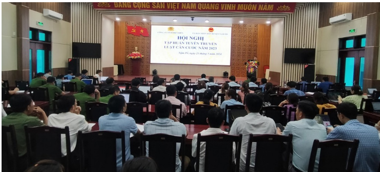
Toàn cảnh Hội nghị tại hội trường HDND-UBND huyện Nậm Pồ

Luật Căn cước số 26/2023/QH15 được Quốc hội khóa XV thông qua tại Kỳ họp thứ 6 ngày 27/11/2023, có hiệu lực thi hành từ ngày 01/7/2024. Nhằm thực hiện có hiệu quả Luật căn cước, ngày 21/5/2024, UBND huyện Nậm Pồ đã phối hợp với Công an tỉnh tổ chức Hội nghị tập huấn, tuyên truyền Luật Căn cước 2023, ứng dụng VneID cho cán bộ chủ chốt của các cơ quan, đơn vị trên địa bàn huyện. Trong đó, xác định cụ thể nội dung công việc, thời hạn, tiến độ hoàn thành và trách nhiệm của các cơ quan, tổ chức có liên quan trong việc triển khai thi hành luật.