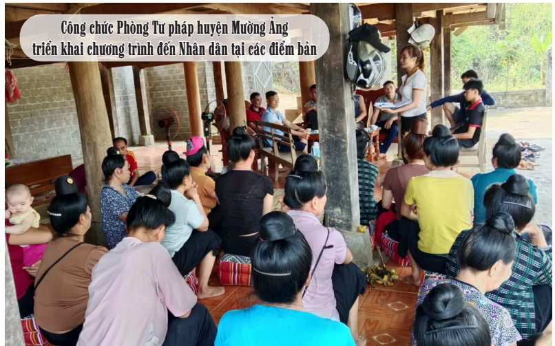
Công chức Phòng Tư pháp huyện Mường Ảng triển khai chương trình đến Nhân dân tại các điểm bản

Ngày 23/4/2024, UBND huyện Mường Ảng ban hành Kế hoạch số 115/KH-UBND về việc thực hiện Nội dung số 02, Tiểu dự án 1 của Dự án 10 thuộc Chương trình mục tiêu quốc gia phát triển kinh tế - xã hội vùng đồng bào dân tộc thiểu số và miền núi trên địa bàn huyện Mường Ảng năm 2024 để triển khai thực hiện theo Chương trình, Kế hoạch đã đề ra.