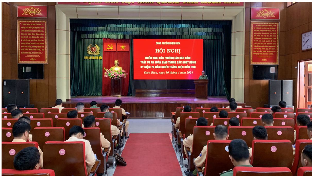
Công an tỉnh tổ chức Hội nghị triển khai các phương án đảm bảo trật tự an toàn giao thông các hoạt động kỷ niệm 70 năm chiến thắng Điện Biên Phủ

Dưới cái nắng oi bức của mùa hè cộng thêm gió Lào khô rát khiến người ta ở trong nhà hay dưới bóng râm vẫn cảm thấy khó chịu, thế nhưng hơn 1 tháng nay, cán bộ chiến sĩ lực lượng Công an Điện Biên vẫn luôn thường trực 24/24 tại các nút giao thông, các điểm di tích lịch sử và nơi diễn ra các hoạt động, sự kiện hướng tới kỷ niệm 70 năm Chiến thắng Điện Biên Phủ. Những việc làm của các anh góp phần quan trọng đảm bảo an ninh, an toàn các đồng chí lãnh đạo Đảng, nhà nước, các sự kiện và du khách thập phương đến với Điện Biên.