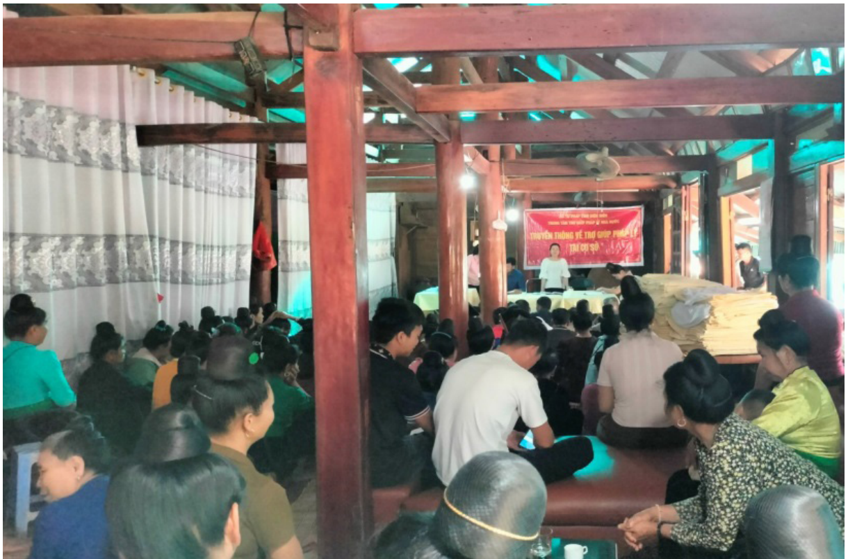
Tuyên truyền pháp luật lưu động tại xã Mường Đăng, huyện Mường Ảng

pháp luật tuyên truyền về Luật Phòng chống bạo lực gia đình, Luật Tiếp cận thông tin; truyền thông về chính sách trợ giúp pháp lý từ đó nâng cao nhận thức người dân về công tác trợ giúp pháp lý, các dịch vụ trợ giúp pháp lý miễn phí; tuyên truyền về phát động phong trào toàn dân tham gia đấu tranh, phòng chống các loại tội phạm ma túy; phòng, chống xuất, nhập cảnh trái phép; mua bán, tàng trữ, sản xuất, sử dụng vũ khí vật liệu nổ; săn bắn động vật hoang dã... Đây là một hoạt động thiết thực, rèn luyện kỹ năng tuyên truyền, phổ biến, giáo dục pháp luật của đoàn viên, thanh niên, góp phần đưa chính sách pháp luật đến gần hơn với bà con Nhân dân tại cơ sở.