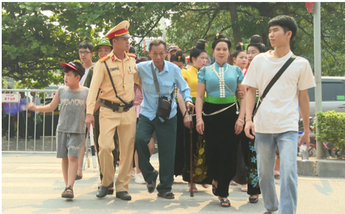
Lực lượng giao thông đưa người già qua đường

Biên Phủ anh hùng, khi cả nước đang hướng về Điện Biên, chúng tôi phấn đấu hoàn thành xuất sắc nhiệm vụ, góp phần tổ chức thành công Lễ Kỷ niệm 70 năm Chiến thắng Điện Biên Phủ”.