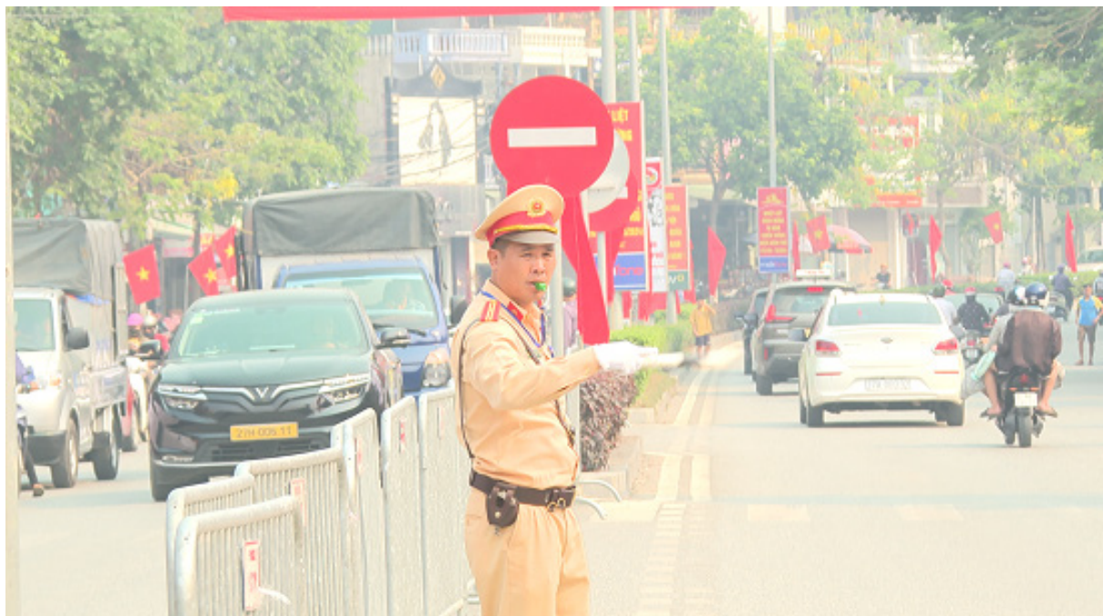
Cảnh sát giao thông làm việc giữa trời nắng, oi bức của mùa hè

thời tiết nắng nóng như thế này, tuy rất vất vả nhưng các đồng chí vẫn vui vẻ, niềm nở, hướng dẫn người dân. Tôi cảm thấy rất hài lòng về chuyên đi, về sự hiếu khách và nhất là thái độ ứng xử của lực lượng Công an”.