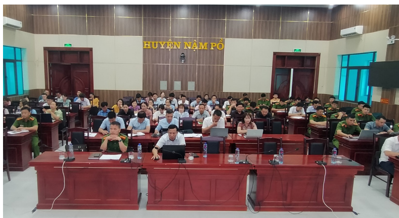
Các đại biểu nghiêm túc tiếp thu nội dung triển khai tại Hội nghị

và hướng dẫn thi hành Luật Căn cước, quy định mẫu thẻ căn cước, mẫu giấy chứng nhận căn cước và quy định tàng thư căn cước, cư trú, về quy trình cấp, quản lý thẻ căn cước. Công an huyện phối hợp với các cơ quan, đơn vị; UBND các xã xây dựng các cơ sở dữ liệu quốc gia, cơ sở dữ liệu chuyên ngành phục vụ kết nối, chia sẻ thông tin với cơ sở dữ liệu quốc gia về dân cư, cơ sở dữ liệu căn cước; bảo đảm an ninh, an toàn thông tin và bảo vệ dữ liệu cá nhân.