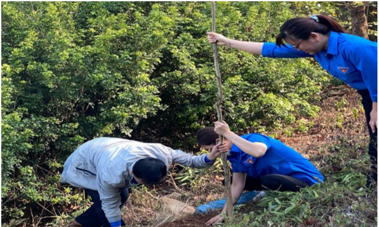
Đoàn viên trồng cây Hoa Ban tại di tích đồi D1

Điện Biên được mệnh danh là xứ sở hoa ban trắng, những cánh rừng hoa nở trắng như tô điểm thêm cho sức sống mãnh liệt của mảnh đất Điện Biên một thuở